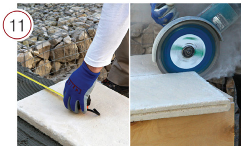
Произведите замеры и, при необходимости, подрезку следующего укладываемого элемента ступени.