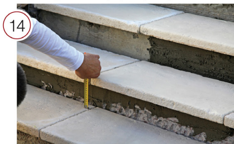
Произведите замеры подступенка и, при необходимости, подрезку.