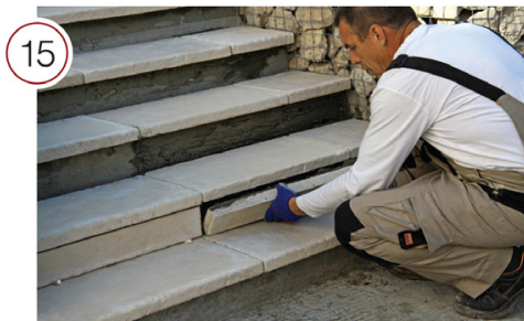
Нанесите гладким шпателем клеевой раствор на тыльную сторону подступенка. Разровняйте клей зубчатым шпателем. Приложите к основанию и, прижав, слегка подвигайте элемент из стороны в сторону, чтобы обеспечить наилучшее сцепление.