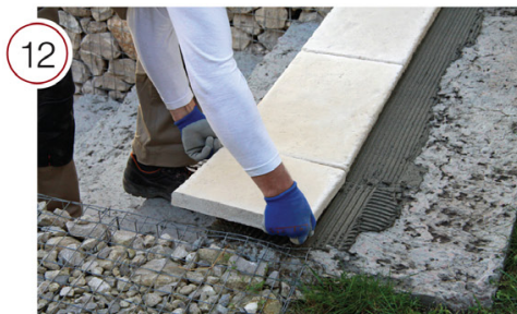
Нанесите гладким шпателем клеевой раствор на тыльную сторону подрезанной ступени. Разровняйте зубчатым шпателем. Приложите ступень к основанию и, прижав, слегка подвигайте из стороны в сторону, чтобы обеспечить наилучшее сцепление. Используйте резиновую киянку.