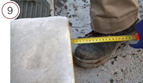
В готовом виде, после приклеивания подступенка, вылет составит 1 см.