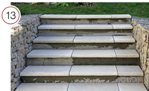
Общий вид без подступенков.